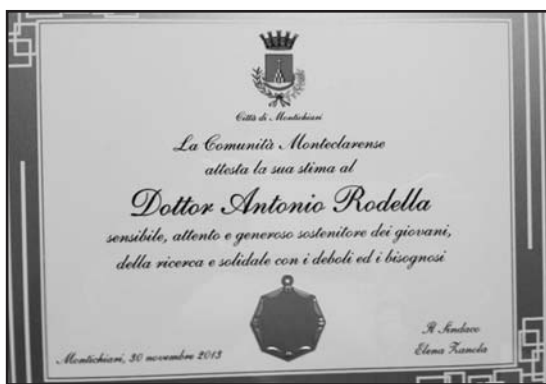
Il riconoscimento dell'amministrazione al dott. Rodella.