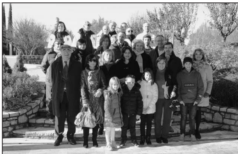
Ricordo della giornata da parte dei partecipanti.

Domenica 1 Dicembre 2013 si è svolta c/o la P.zza Santa Maria Assunta di Montichiari la Giornata Mondiale del Diabete. Vi hanno attivamente partecipato i sanitari della Diabetologia e Malattie del Ricambio del Presidio Ospedaliero di Montichiari, la locale sezione dell'Associazione Diabetici della Provincia di Brescia (dedicata alla Sig.ra Nizzola Fernanda), i volontari della locale Sezione della Protezione Civile. Per tutta la mattinata il personale addetto ha sensibilizzato la popolazione della cittadina Montecolare riguardo le problematiche legate alla patologia diabetica, testando sia i valori glicemici che i dati antropometrici (altezza, peso, Indice di Massa Corporea, pressione arteriosa) di quasi 100 cittadini e distribuendo materiale informativo riguardo la prevenzione e cura di tale patologia. Anche quest'anno i dati del nostro screening fanno registrare la scoperta di due persone con