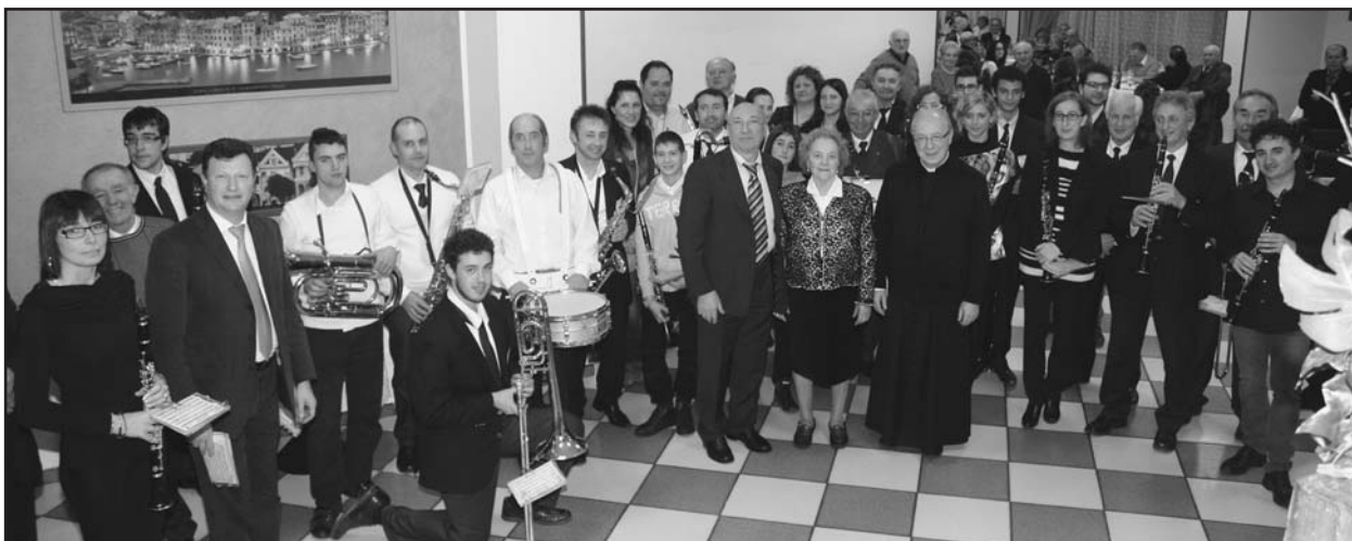
Ricordo della S. Cecilia, edizione 2013, presso il Green Park Boschetti.